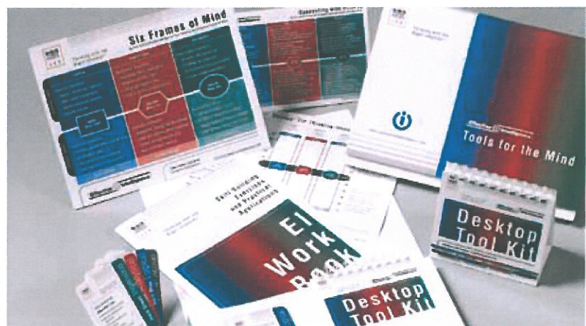
Ledelsesværktøjet Effective Intelligence™